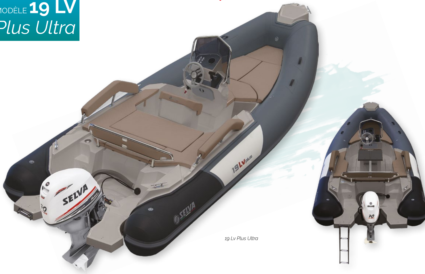
19 Lv Plus Ultra