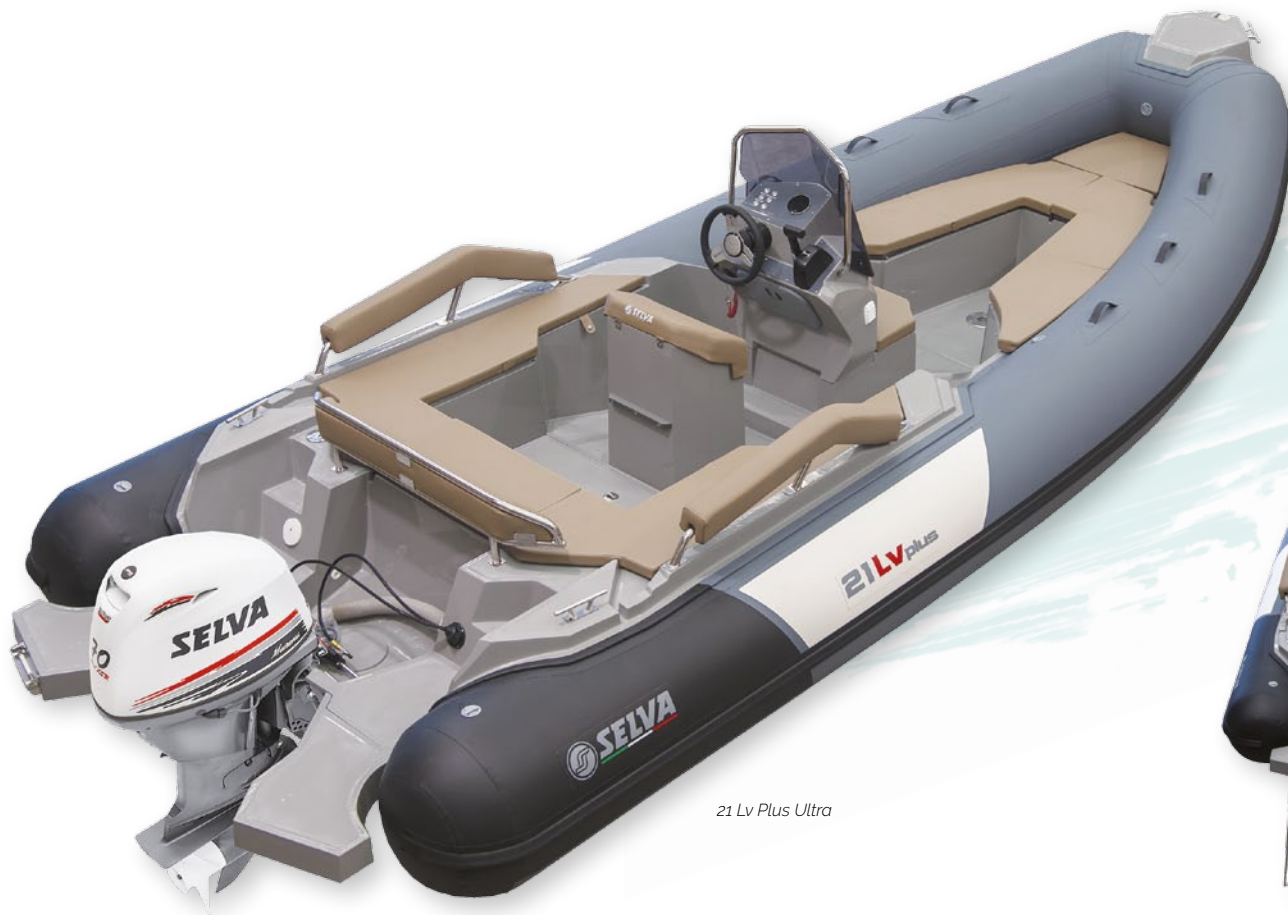
21 Lv Plus Ultra