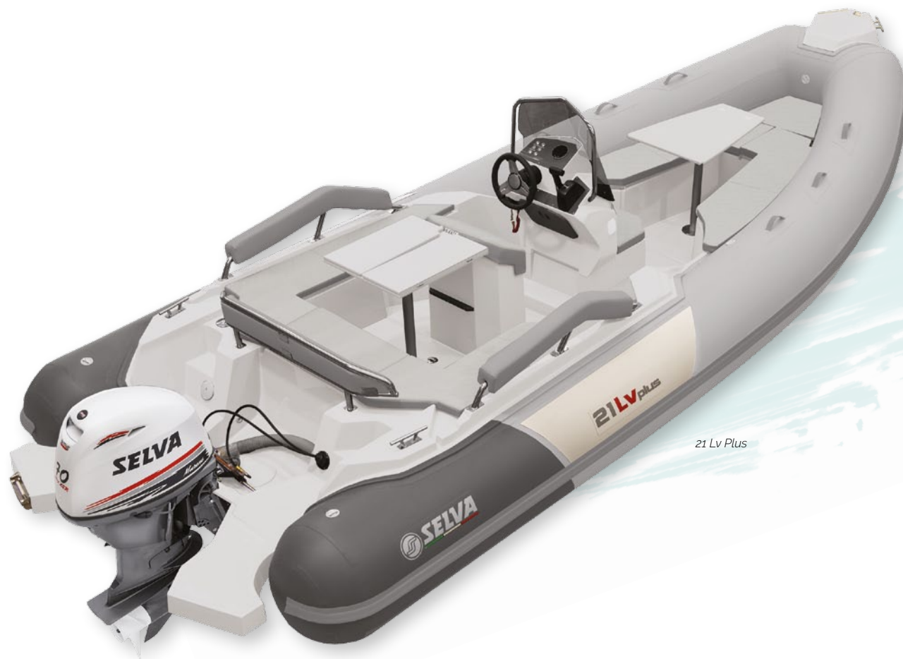
21 Lv Plus